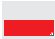
2/2 Seiten (a) 436 x 134 mm