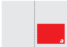
1/2 Seite (a) 206 x 134 mm