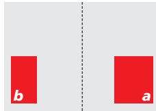
3/10 Seite (a) 122 x 134 mm