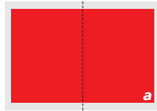
2/1 Seiten (a) 436 x 289 mm