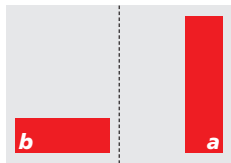
2/5 Seite (a) 80 x 275 mm