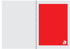
1/1 Seite (a) 206 x 289 mm