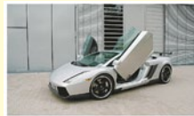
Gallardo GTR mit Motortuning bis 448 kW/610 PS, Bj. 07, Aerodynamik, Carbonteile, 19/20" Räder, Fwk., Flügelstützen, Sportlenkrad, Sitze, Carboninterieur. Tel. 0611/5056060, www.dimex-group.com H

Fliessatz mit Foto unser Beispiel: 5 Zeilen + Bild CHF 174.50